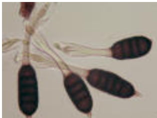
Observation de plusieurs téleutospores au microscope optique