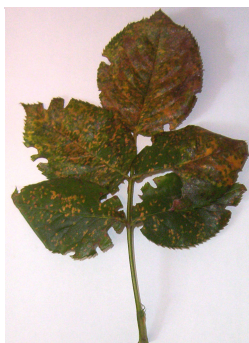
Dégâts de rouille sur rosier à la face supérieure du limbe

Les symptômes observés sont visibles sur les deux faces du limbe :